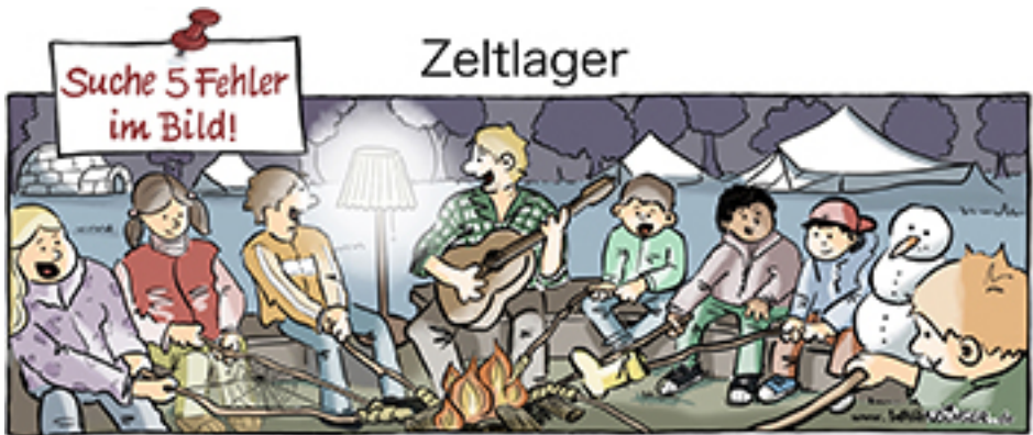
lglu, Spinnweb, Lampe, Stiefel, Schneemann

Änderungen und Kürzungen eingehender Artikel und deren Abdruck behält sich die Redaktion vor.