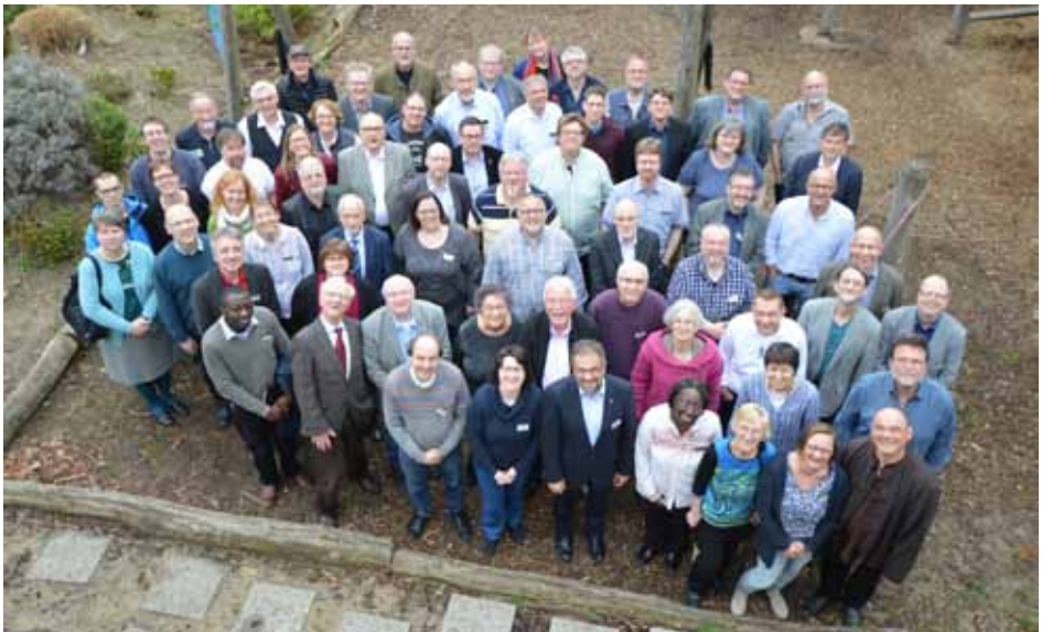
Pastoren und Pastorinnen der Norddeutschen Konferenz