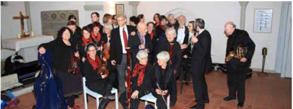
Das Ottersberger Kammerorchester